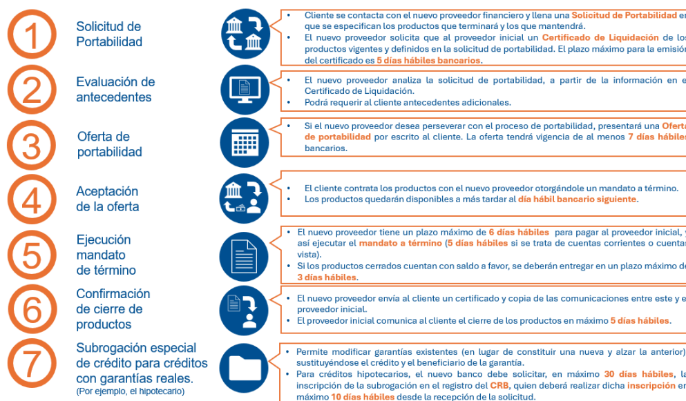
Gráfico 3. Visión general del proceso de Portabilidad financiera en Chile