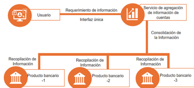
Gráfico 2. Visión general de un modelo de Agregación de información de cuentas