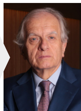
Armando Montenegro Exdirector del Departamento Nacional de Planeación.

E l próximo año se celebran cien años de la misión Kemmerer, una iniciativa del presidente Pedro Nel Ospina que, en 1923, dio origen a la transformación del ministerio de Hacienda y a la creación de tres entidades clave en la vida económica colombiana: el Banco de la República, la Superintendencia Bancaria y la Contraloría General de la República. Era evidente entonces que las precarias instituciones económicas heredadas del siglo XIX resultaban un obstáculo que impedía la modernización del país. Los dirigentes políticos y empresariales de entonces eran conscientes de que para hacer sostenible el crecimiento era necesario que el país presentara ante la comunidad financiera y empresarial, nacional e internacional, la evidencia de que contaba con un sistema fiscal organizado, un sistema bancario sólido y un manejo monetario moderno.