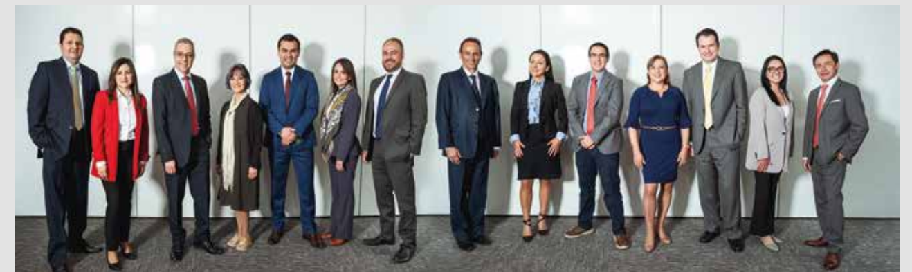
COMITÉ DIRECTIVO DE ACH COLOMBIA, compañía que celebra 25 años.

Finalmente está su servicio más reciente: el modelo de transferencias inmediatas de persona a persona (P2P) en Colombia, Transfiya, que ha permitido enviar, recibir y solicitar dinero logrando más de 7 millones de transferencias en el primer semestre de 2022, entre las quince entidades financieras vinculadas, dentro de las cuales hay bancos, cooperativas, billeteras móviles y SEDPES.