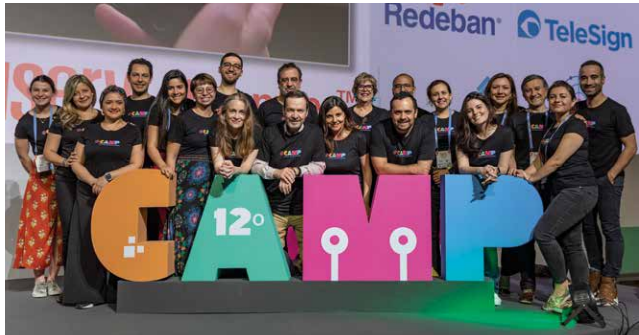
» Foto grupal del equipo de Asobancaria en el Congreso de Acceso a Servicios Financieros y Medios de Pago (CAMP).